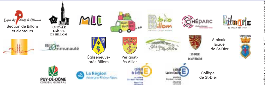
Réalisation Jeanne BORNET - Imprimerie CAVANAT - Billom

Du 25 Mars au 8 Avril Lundi 10h00-11h30 | Mercredi 10h00 -12h00 / 14h00-18h00 | Vendredi 16h30-18h30 | Samedi 10h00-12h00